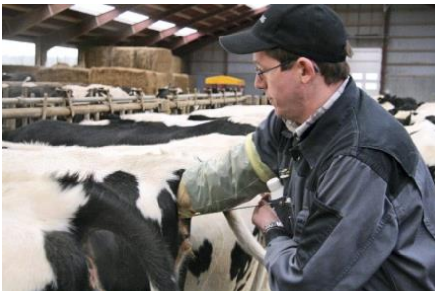
Inseminørundersøgelse = Facit